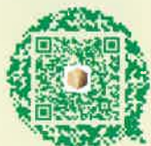
微信公众号 国科大心理中心

微信公众号“国科大心理中心”，信息及时、内容丰富，师生联系的重要桥梁，获取专业资源的重要渠道。